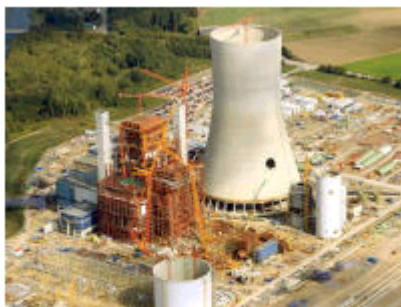
Die Baustelle des Kohlekraftwerks in Datteln.

CASTROP-RAUXEL/DATTELN Im Rechtsstreit um den Bau des Steinkohlekraftwerks im benachbarten Datteln haben die Stadt Datteln und E.ON eine weitere juristische Niederlage hinnehmen müssen.